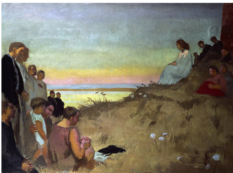
Le sermon sur la montagne. Huile sur toile du nabi Maurice Denis (1870-1943). La prière du « Notre Père », commune à tous les chrétiens, se trouve dans l'Evangile de Matthieu, 6 : 9-13.

La nouvelle traduction française catholique de la Bible liturgique, publiée en novembre dernier, suscite nombre d'interrogations. Notamment face aux changements apportés à la plus célèbre des prières qui visent à montrer qu'il n'y a pas, en haut des cieux, un Dieu sadique, voire pervers qui prendrait plaisir à tester ses fidèles.